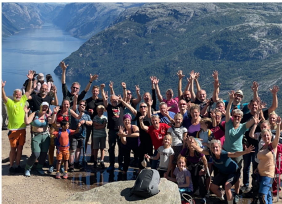
Døves Nordiske Kulturfestival. Dagstur til Preikestolen i nydelig solskinnsvær med døve og hørselshemmede fra Norden og Europa.

Vi spurte alle deltakerne og de kunne fortelle at de alle var kjempefornøyde. Vi var så glade at festivalen var meget