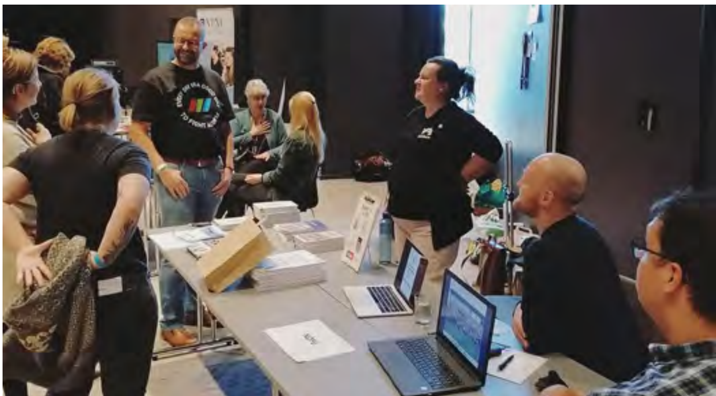
Drammen Døveforening arrangerte Døves Kulturdager 24.–26. september, og det var 200 deltakere som var innom i løpet av helgen, på Quality Hotel River Station, i Drammen. På programmet var det stands, workshops og skuespill.